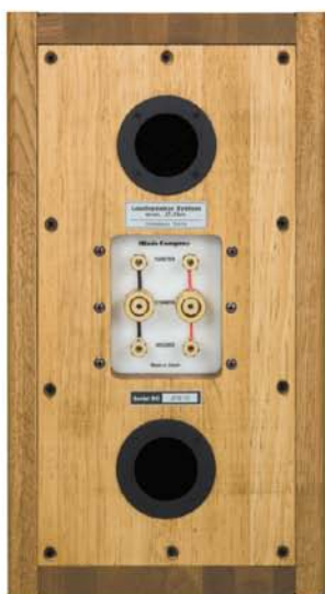
背面 (オリジナル仕様)