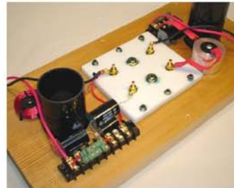
入力端子とネットワーク (写真はJZ-1仕様)