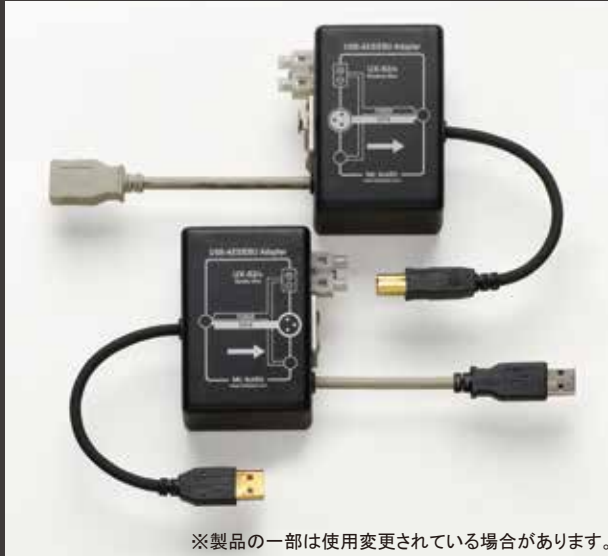
※製品の一部は使用変更されている場合があります。